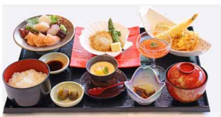
KITANOSACHI-GOZEN ¥4,400 A set made with plenty of ingredients from Hokkaido