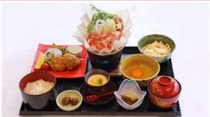
SANGENTON-GOZEN ¥3,300 Sukiyaki made with Hokkaido "SANGENTON" pork

Set to taste the ingredients of Hokkaido