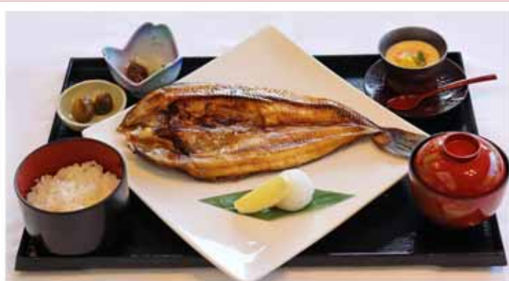
HOKKE-GOZEN ¥2,400 Salt-grilled Atka mackerel set