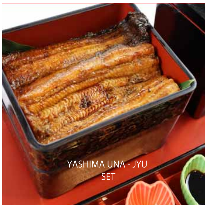
YASHIMA UNA - JYU SET