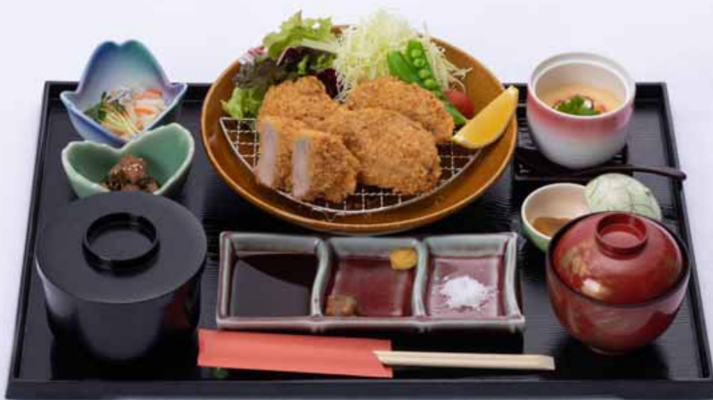
PORL FILLET CUTLET - GOZEN