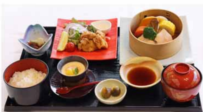
SHIRETOKODORI-GOZEN ¥2,500 Shiretoko chicken dish set