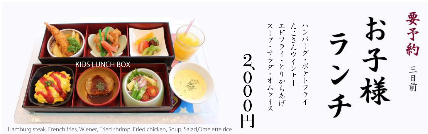
Hamburg steak, French fries, Wiener, Fried shrimp, Fried chicken, Soup, Salad, Omelette rice