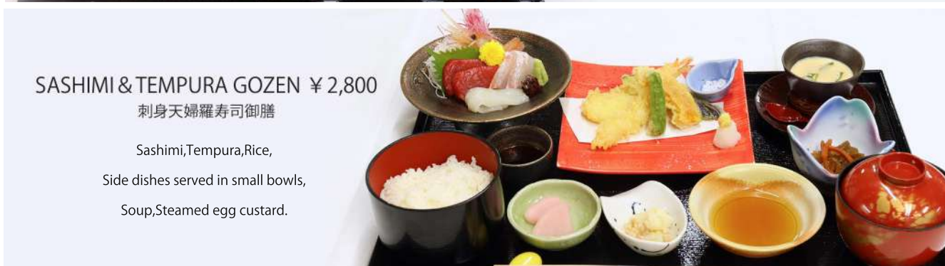
SASHIMI & TEMPURA GOZEN ¥2,800

Soba, Tempura, Sushi, Side dishes served in small bowls, Soup, Steamed egg custard.