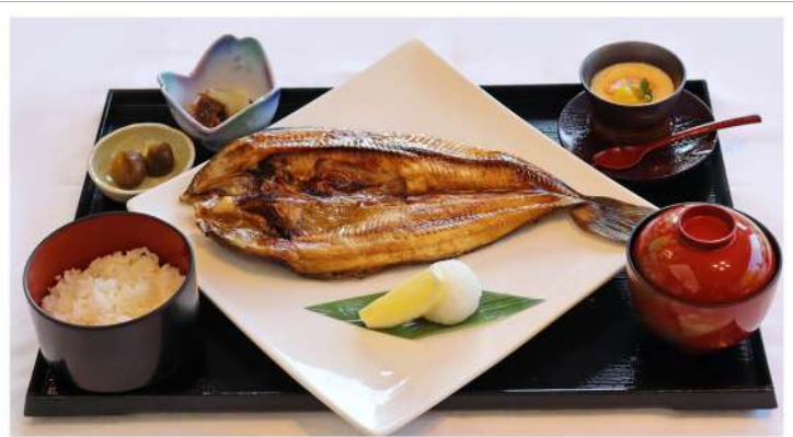
HOKKE-GOZEN ¥2,400 Salt-grilled Atka mackerel set