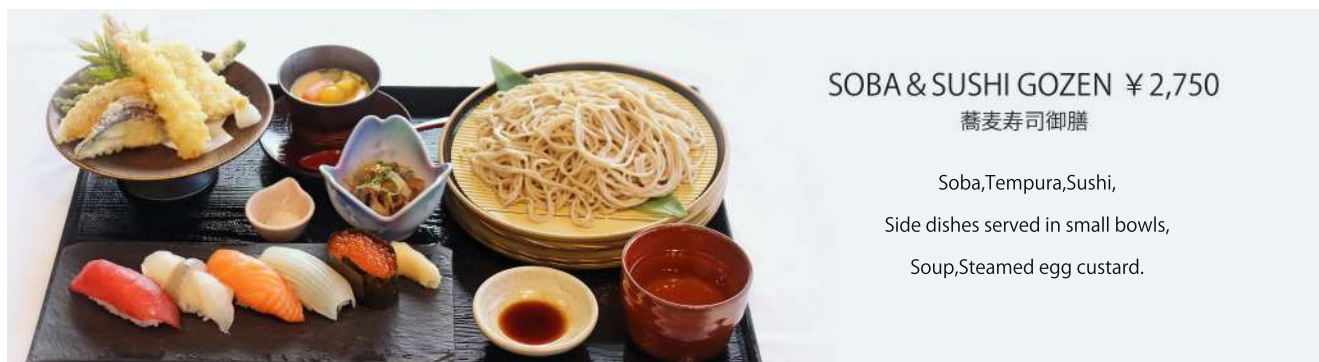
SOBA & SUSHI GOZEN ¥2,750