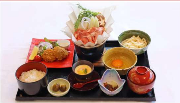
SANGENTON-GOZEN ¥3,300 Sukiyaki made with Hokkaido "SANGENTON" pork

Set to taste the ingredients of Hokkaido