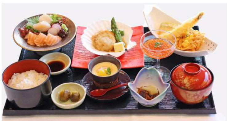
KITANOSACHI-GOZEN ¥4,400 A set made with plenty of ingredients from Hokkaido