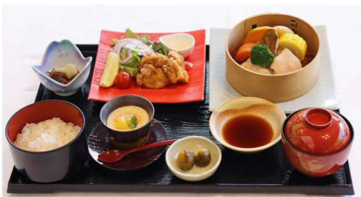
SHIRETOKODORI-GOZEN ¥2,500 Shiretoko chicken dish set

全メニューサービスドリンク（コーヒー/紅茶/オレンジジュース）付 All the lunch menus include coffee, tea or orange juice.