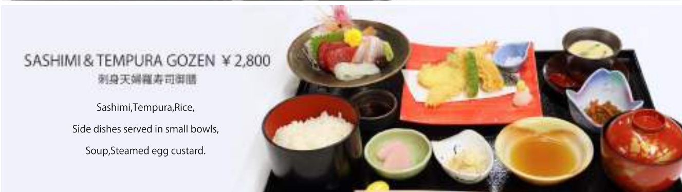
SASHIMI & TEMPURA GOZEN ¥2,800 刺身天婦羅寿司御膳

Soba, Tempura, Sushi, Side dishes served in small bowls, Soup, Steamed egg custard.