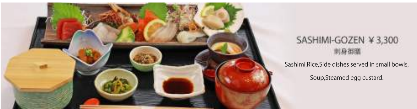
SASHIMI-GOZEN ¥3,300 刺身御膳

Sashimi, Tempura, Rice, Side dishes served in small bowls, Soup, Steamed egg custard.