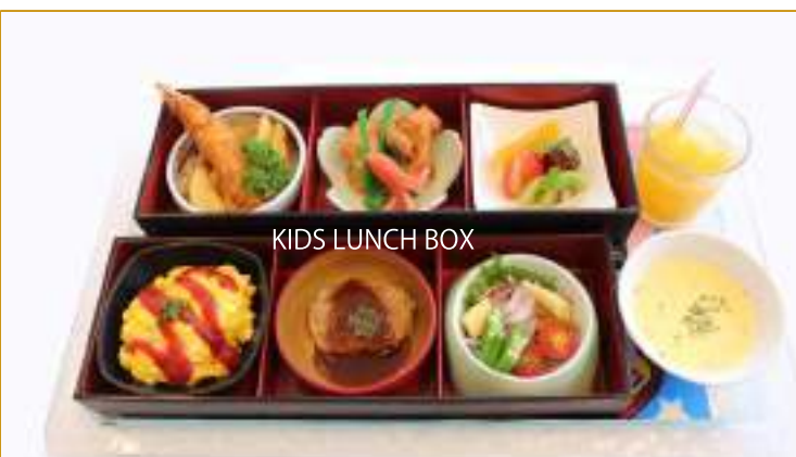
Hamburg steak, French fries, Wiener, Fried shrimp, Fried chicken, Soup, Salad, Omelette rice