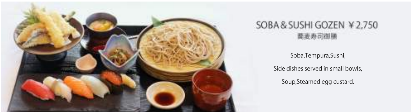
SOBA & SUSHI GOZEN ¥2,750 蕎麦寿司御膳

Soba, Tempura, Sushi, Side dishes served in small bowls, Soup, Steamed egg custard.